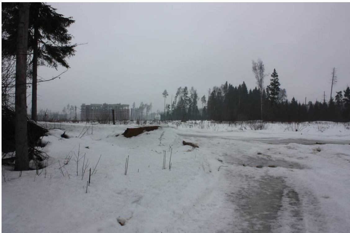
Рис. 3.1.2. Общий вид временной подъездной дороги