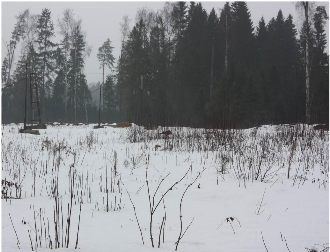
Рис. 3.1.1. Общий вид смонтированных опор наружного освещения